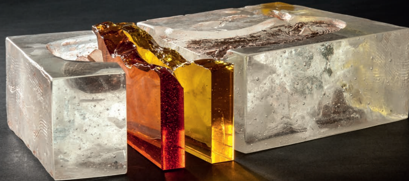
Abbildung: Landschaft im Augenblick No.7

nach Vereinbarung W. Dörenbecher, Mobil 0163/8670484